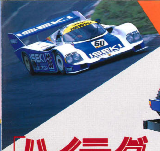
ISEKI PORSCHE956 #セキボクシム956

⊕ お子様を同乗させたり、作業時そばに近づけないでください。泣かれても、せがまれても、ガマンしましょう！