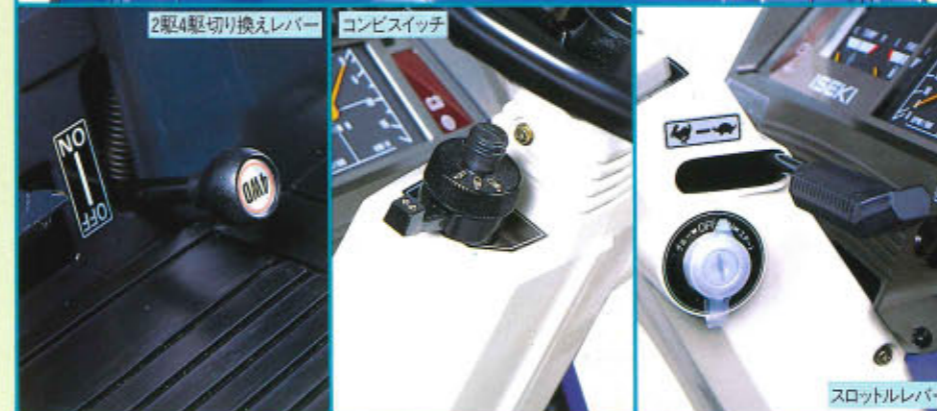
2駆4駆切り換えレバー