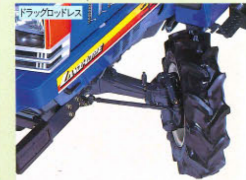
ドラッグロッドレス

ドラッグロッドレスの採用で、切れ角が大きくなりました。しかも、4WDですので強力な走行性能を発揮します。(F型)