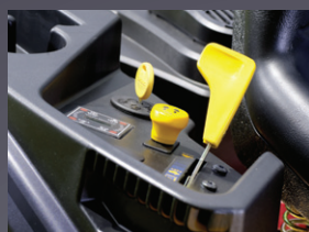
EMBRAYAGE ÉLECTRO MAGNÉTIQUE DES LAMES