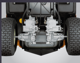
DOUBLE TRANSMISSION HYDROSTATIQUE