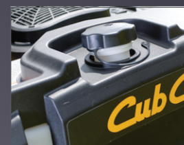
RÉSERVOIR GRANDE CAPACITÉ