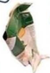
Brique en carton