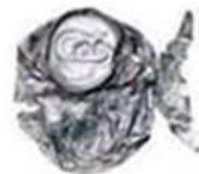
Canette en aluminium