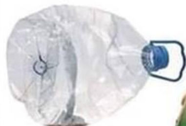
Bidon en plastique