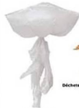
Sac en plastique