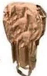
Sac en papier