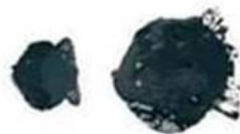
Carburant ou huile moteur