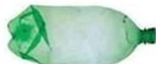
Bouteille en plastique