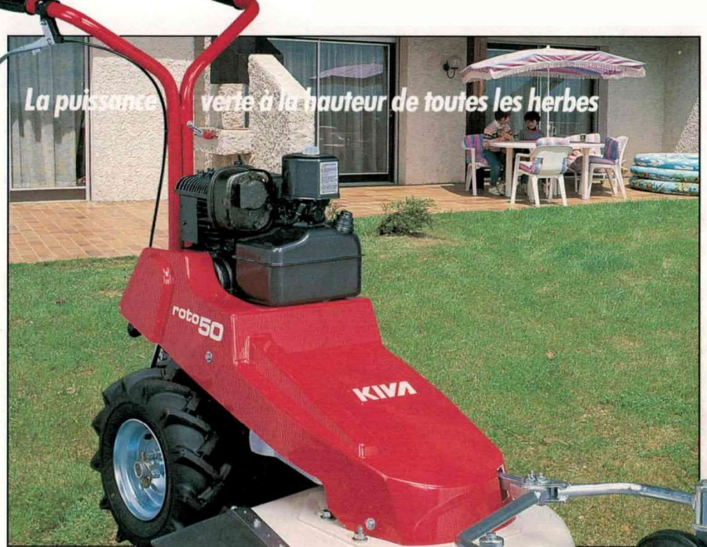
ROTO 50 VL

Tondeuse-Faucheuse, la ROTO 50 est capable de bien couper toutes les variétés d'herbes sans limite de hauteur. Elle assure ainsi l'entretien sans contrainte de toute propriété.