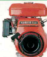
Moteur Kubota GS.200 (201 cc) - 5,0 CV