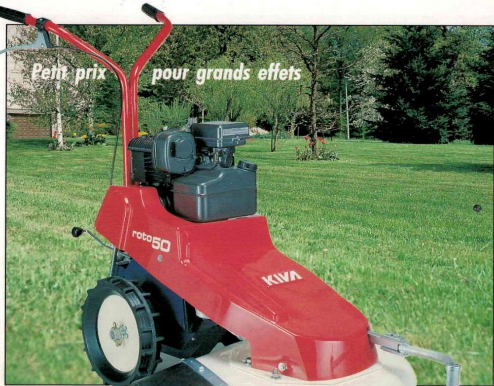
ROTO 50 VR

Tondeuse, faucheuse, la ROTO 50 VR (vitesse rapide) est capable de couper toutes sortes d'herbes petites et grandes et de mettre à net le plus luxuriant des jardins.