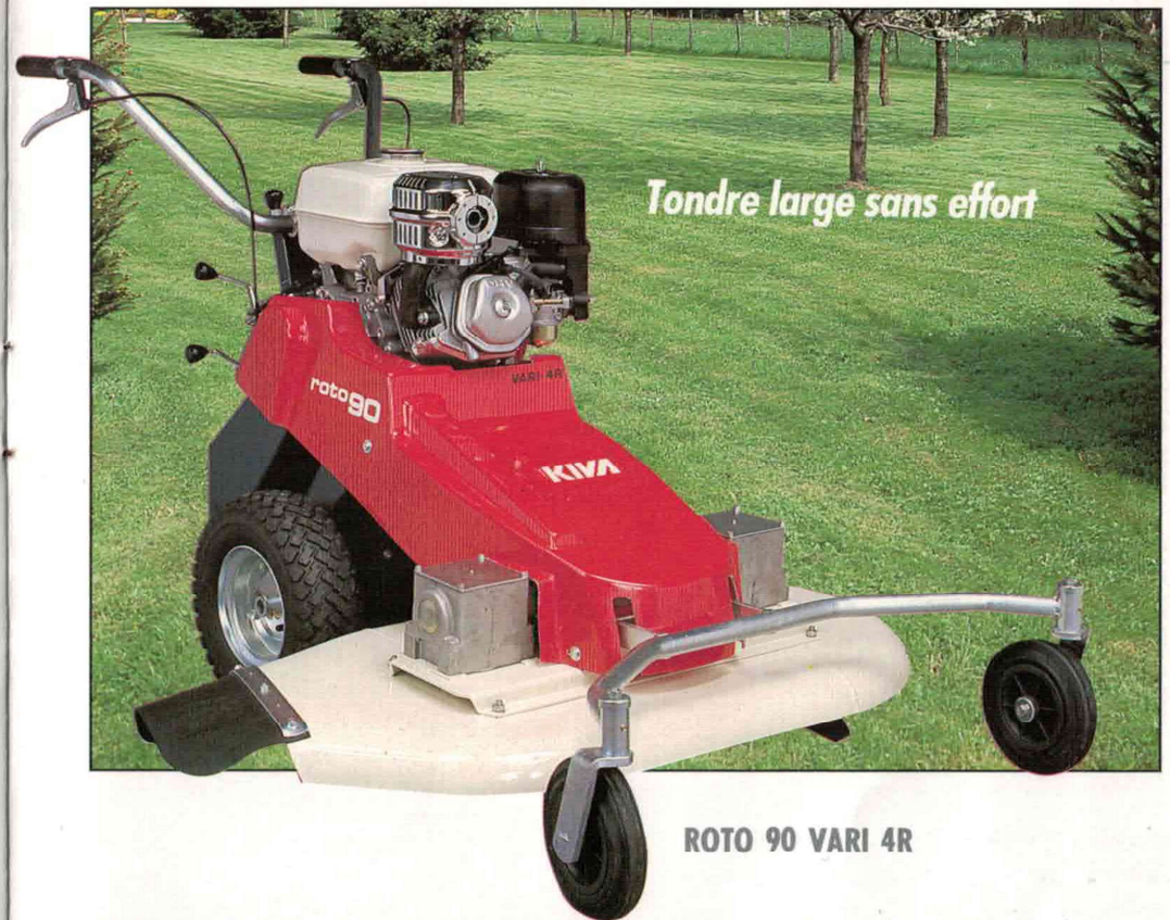
ROTO 90 VARI 4R

TONDEUSE de grande largeur, la ROTO 90 VARI 4R coupe 92 cm dans du gazon ou de l'herbe jusqu'à 40 cm de haut! Avec 4 vitesses et marche arrière, une boîte-pont différentiel pour la maniabilité, un moteur de 8 CV et 2 lames, les résultats sont là: une coupe nette et régulière et une belle finition.