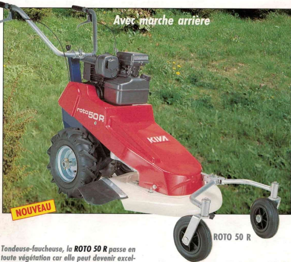
ROTO 50 R

Tondeuse-faucheuse, la ROTO 50 R passe en toute végétation car elle peut devenir excellente DEBROUSSAILLEUSE si l'on remplace ses roues avant par un patin* et ses roues agraires 3.50/6 par des roues increvables* (*options).