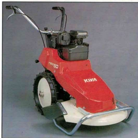
ROTO 50 R modèle 88 avec option roue pleine et patin