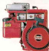
Moteur Briggs & Stratton I/C (206 cc) - 5,0 CV