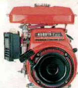
Moteur Kubota GS.130 (130 cc) - 3,0 CV