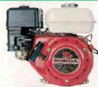
Moteur Honda GX.140 (144 cc) - 5,0 CV