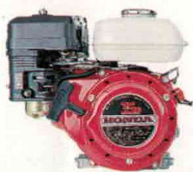
Moteur Honda GX.110 (107 cc) - 3,5 CV

Moyennant un supplément, certaines machines peuvent être livrées avec les moteurs suivants :