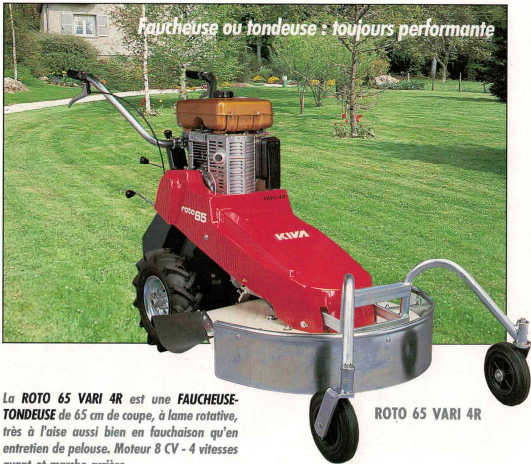
ROTO 65 VARI 4R

Faucheuse ou tondeuse : toujours performante