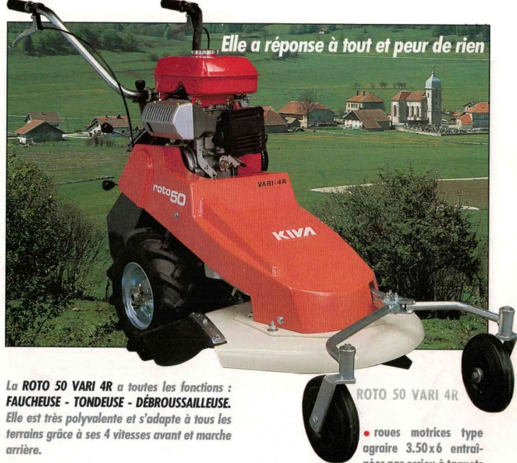
ROTO 50 VARI 4R

La ROTO 50 VARI 4R a toutes les fonctions : FAUCHEUSE - TONDEUSE - DEBROUSSAILLEUSE . Elle est très polyvalente et s'adapte à tous les terrains grâce à ses 4 vitesses avant et marche arrière.